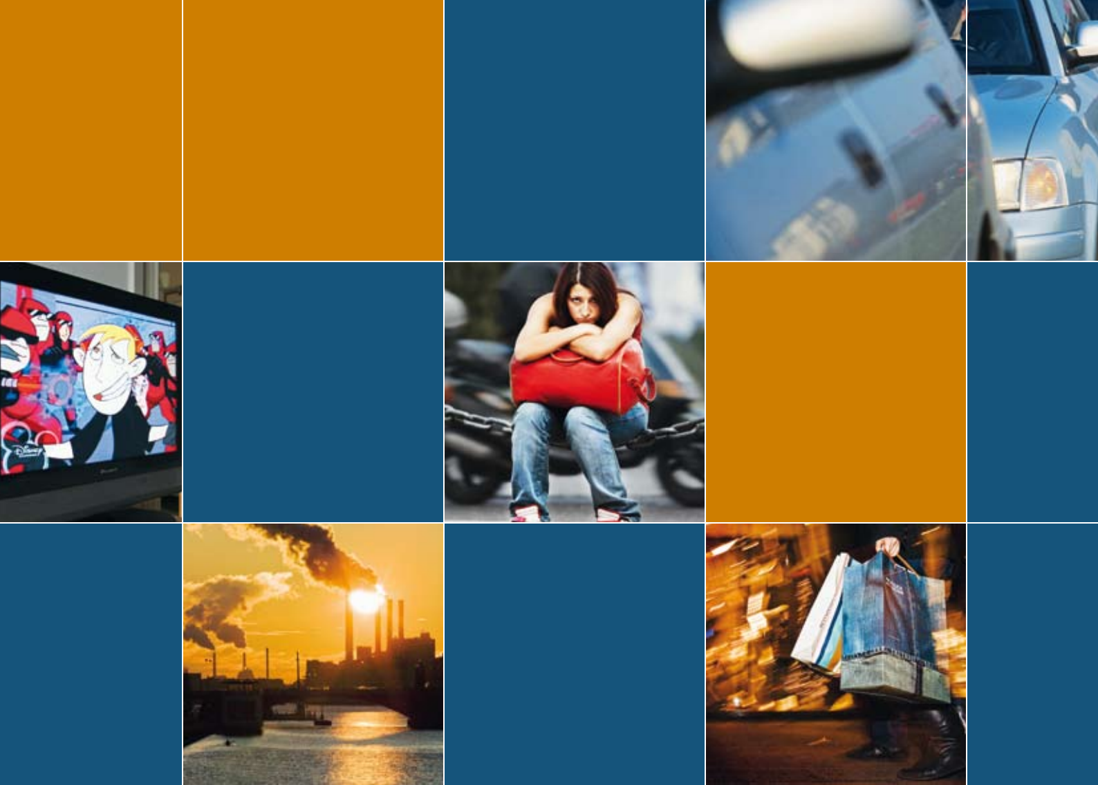
Tidsbillede ■ Af Benjamin Katz